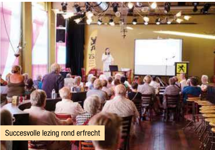
Succesvolle lezing rond erfrecht

De seniorenafdeling van N-VA Sint-Niklaas VSI gaf meer informatie en duidelijkheid over het erfrecht in Vlaanderen. De uiteenzetting in De Foyer werd druk bijgewoond. Een notaris gaf de aanwezigen antwoorden op hun vragen, bezorgdheden en praktische bekommernissen.