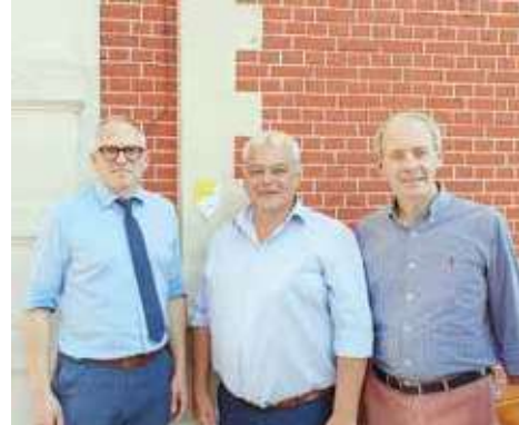
Vlaams minister voor Onroerend Erfgoed Matthias Diependaele te gast in Sint-Niklaas naar aanleiding van Open Monumentendag.

“Het kostte bloed, zweet en tranen maar ‘R de musical’ was het absolute hoogtepunt van de zomer.”