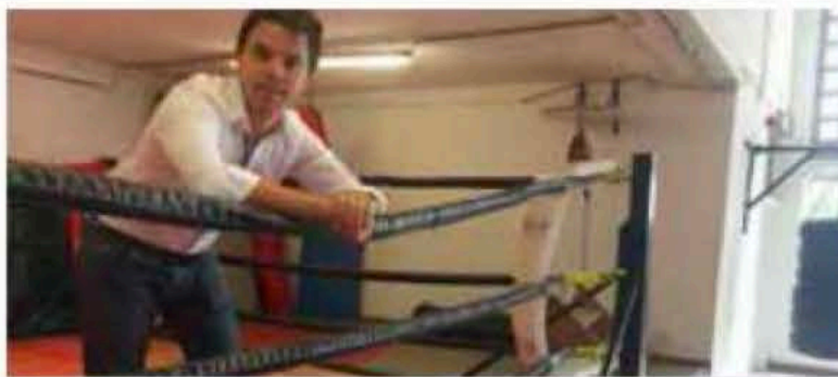
Vernieuwing sportzaal Sinbad van start p. 3