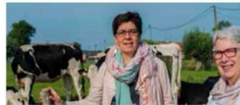
Stadsbestuur steunt landbouwers p. 5