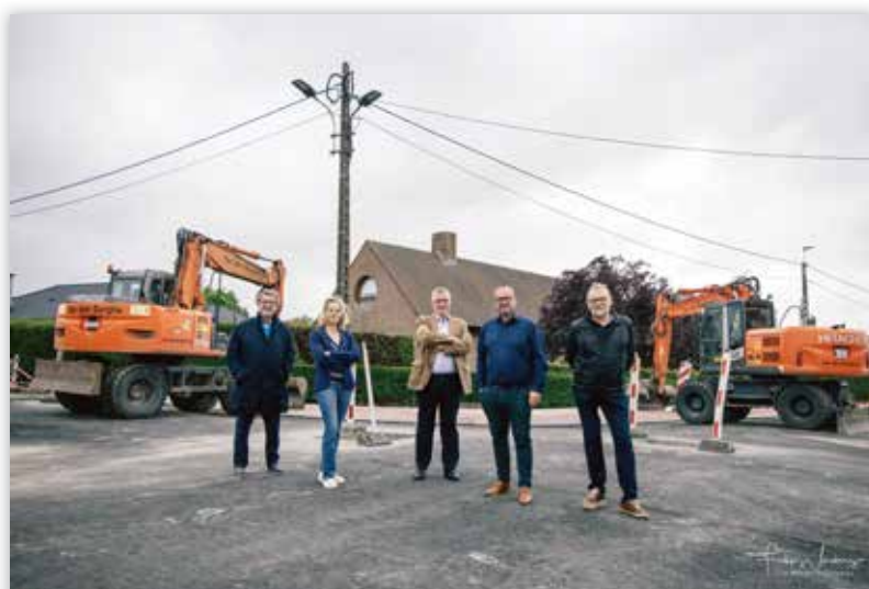
▲ Nu de werken in de Nauwstraat bijna achter de rug zijn, zal Puivelde opnieuw vlot bereikbaar zijn via de Ossenhoek. (Foto werd genomen voor de huidige coronamaatregelen).