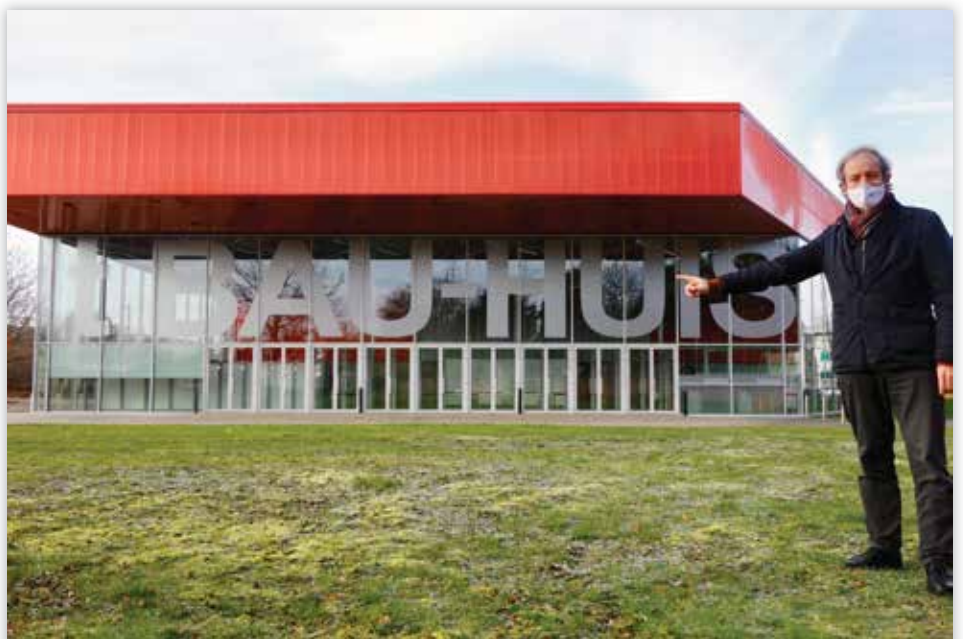
▲ Burgemeester Lieven Dehandschutter wijst ons de weg naar het vaccinatiecentrum in 't Bau-huis.