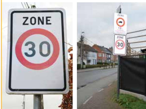
▲ Sint-Niklaas wil niet alleen in de binnenstad een algemene zone 30 invoeren. Ook in een aantal woonwijken in de rand – zoals hier in de Bekelstraat – is de maximumsnelheid 30 km/uur.

De maatregel gaat in principe in vanaf midden 2021 na goedkeuring in de gemeenteraad.